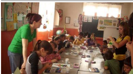
ALBA IULIA | Copiii romi participă la acțiuni de socializare

Comunitatea de romi din localitatea Uioara de Sus, orașul Ocna Mureș, beneficiază de un proiect în valoare de 126.904 euro cu care se finanțează modernizarea unei străzi și dezvoltarea de servicii sociale pentru populație.